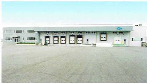
平成5年9月 小名浜芳浜に小名浜超低温冷蔵庫 /小名浜工場新設、操業開始