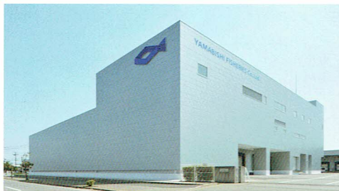
平成25年5月 新社屋、本社工場操業開始