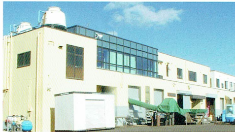
昭和60年12月 中之作港湾に本社屋新築し本社工場操業開始