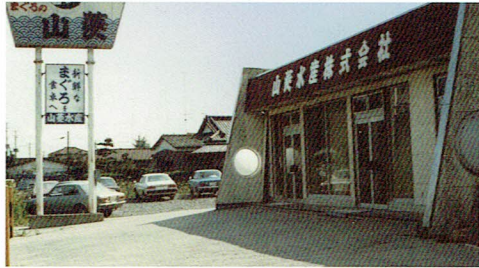
昭和52年2月 海産物卸問屋「山菱水産」創立